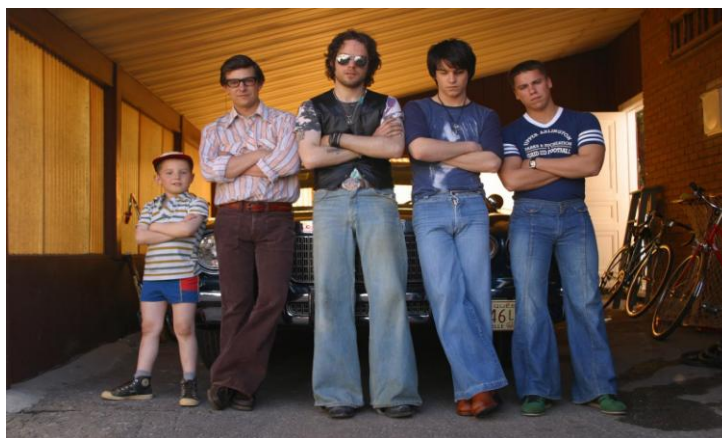
Figura 3 – C.R.A.Z.Y – Loucos de amor