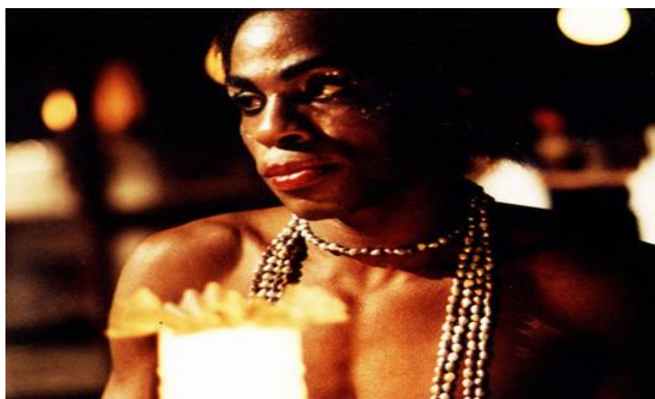
Figura 4 – Madame Satã