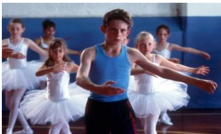
Figura 1 – Billy Elliot