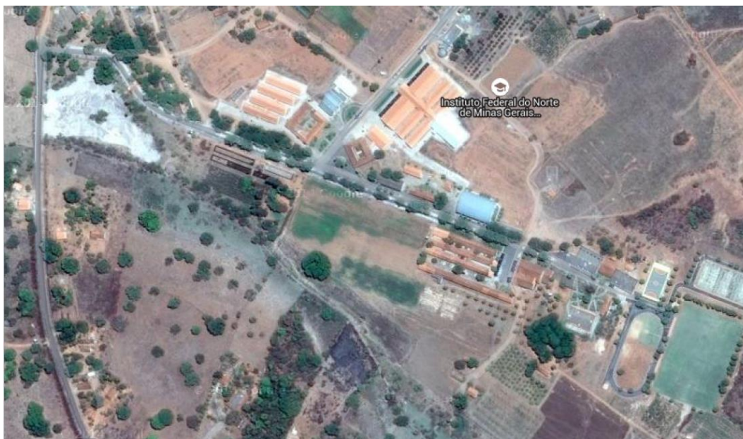
Figura 01 – Vista aérea parcial do Câmpus Januária do Instituto Federal do Norte de Minas Gerais.